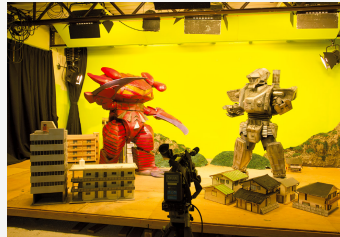
映像学科には特撮専用の撮影スタジオが。 キャラクタースーツからミニチュアまで、自分 たちの手で制作し、キャンパス内にセットを組 む(右)。また、放送学科では放送局と同等の テレビスタジオや中継車を備えている(左)