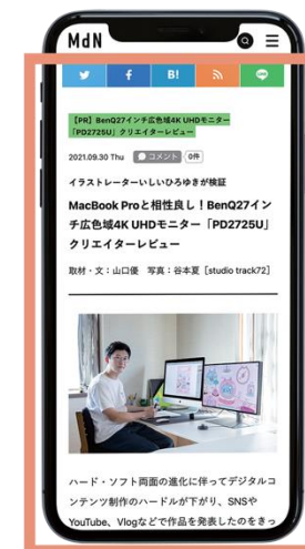
広告記事イメージ