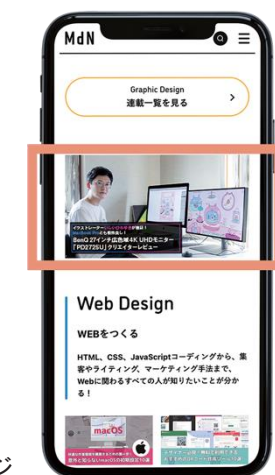
バナー広告イメージ