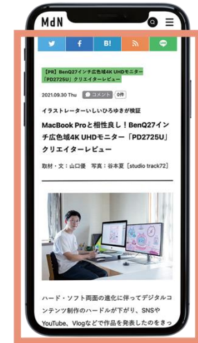
広告記事イメージ