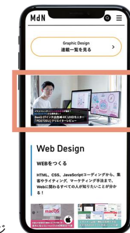
バナー広告イメージ